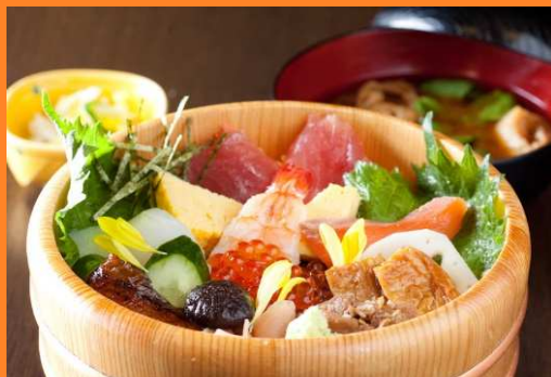
花ちらし(赤だし付き) 1580円(税込)