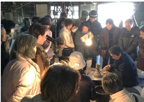
↑当主によるろくろの実演 (有料:5000円程度)

登り窯をはじめ、古き伝統の技や建物を残す歴史ある窯元。 瀬戸蔵ミュージアム内にあるやきもの工場の原型になりました。