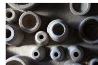
ギャラリーでお買い物もできます